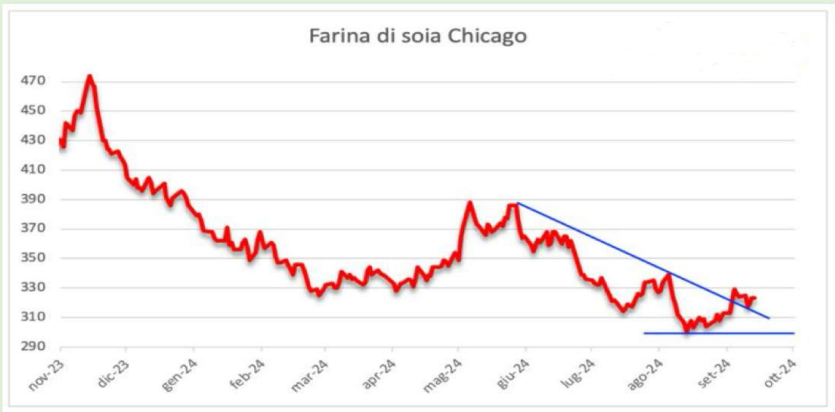
Analisi dei prezzi della farina di soia quotata a Chicago (scadenza dicembre '24)

Si prevedono aumenti nei primi mesi del 2025 causati da burocrazia e scorte nei magazzini dei porti. Sconosciute per gli stessi motivi anche le quotazioni per contratti annuali. L'andamento dei prezzi a Chicago (vedi sotto), sembrano decretare in effetti la fine del ribasso